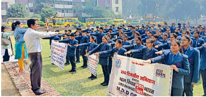
झज्जर। बाल विवाह रोकने संबंधी शपथ लेते हुए विद्यार्थी एवं शिक्षक।