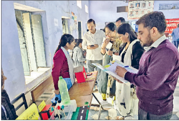
झज्जर। प्रदर्शनी का अवलोकन करते हुए निर्णायक मंडल के सदस्य।