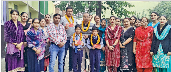
झज्जर। शिक्षकों के साथ मंच पर उपस्थित होनहार खिलाड़ी।