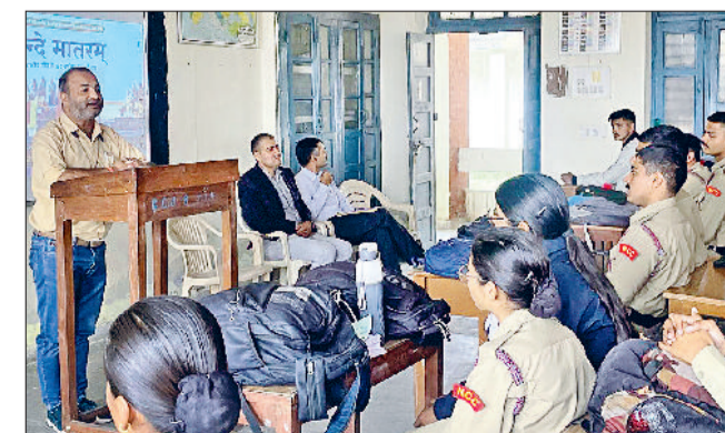
झज्जर। एनसीसी कैडेट्स को संबोधित करते हुए मुख्य वक्ता।