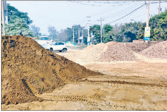
बहादुरगढ़। सेक्टर-2 के सामने खुले में पड़ी भवन निर्माण सामग्री व प्रशासन की सख्ती के बाद ढका गया बिल्डिंग मेटिरियल।

बता दें कि वायु प्रदूषण हर वर्ग के लोगों को प्रभावित करता है, मगर बच्चों और बूढ़ों को बीमारियाँ जल्द पकड़ लेती हैं। हवा में धुंध और धूल इतनी बढ़ जाती है कि आँखों में जलन और सांस लेने में तकलीफ होती है।