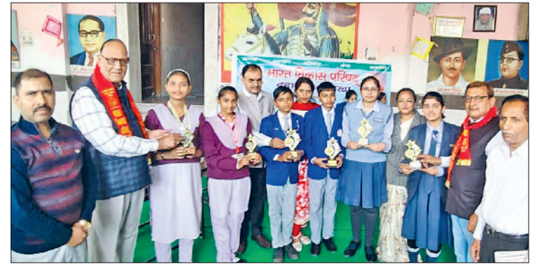
बहादुरगढ़। विजेता विद्यार्थियों को सम्मानित करते भाविय पदाधिकारी।