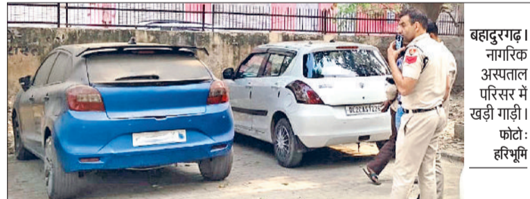
बहादुरगढ़। नागरिक अस्पताल परिसर में खड़ी गाड़ी।