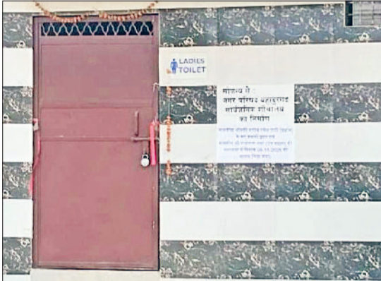
बहादुरगढ़। उद्घाटन के बावजूद बंद पड़ा सार्वजनिक शौचालय।