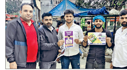
बहादुरगढ़। मेट्रो स्टेशन के निकट पंपलेट वितरित करते युवा कांग्रेसी।

युवा कांग्रेस की ओर से वीरवार को शहर में वोट चोर गद्दी छोड़ अभियान चलाया गया। इसके तहत सिटी मेट्रो स्टेशन, पुराना बस स्टैंड, नजफगढ़ रोड और रोडवेज बसों में युवा कार्यकर्ताओं ने लोगों को लोकतंत्र की सुरक्षा और माताधिकार के महत्व के प्रति लोगों को जागरूक किया। आम नागरिकों, दुकानदारों और यात्रियों को वोट चोरी के खिलाफ पंपलेट वितरित किए और लोगों से