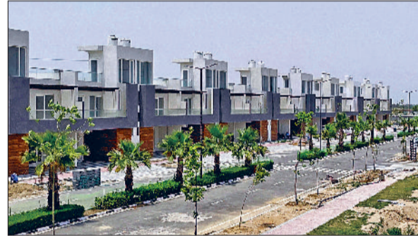
बहादुरगढ़। करीब 40 एकड़ में विकसित की गई रॉयल ग्रीन काउंटी।